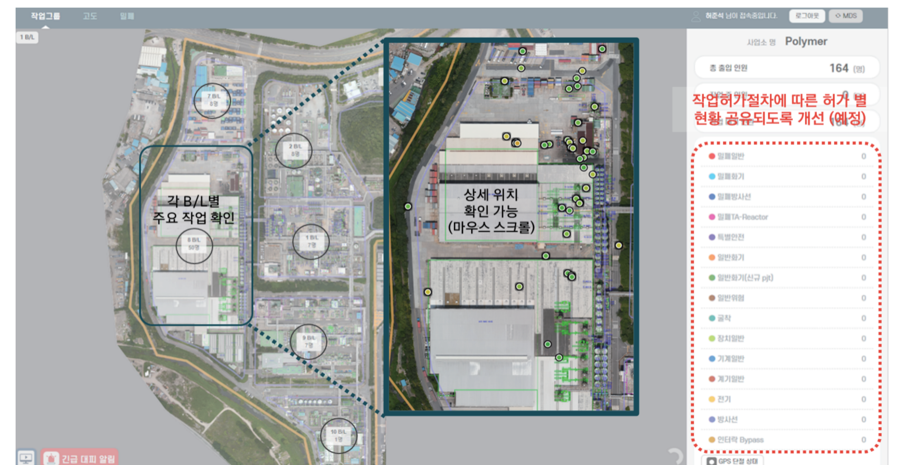
작업 현황 Monitoring